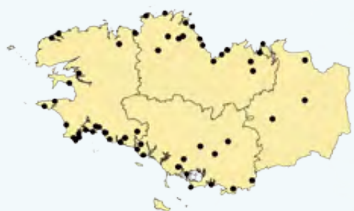
Distribution des jardins avec observation de Bruant zizi en janvier 2020

Curieux et inoubliable nom que celui du Bruant zizi, attribué à son chant inlassablement répété tout au long de l'année "zizizizi". Le mâle arbore un élégant masque facial noir et jaune et les côtés de la poitrine roux. La femelle et les jeunes sont à dominante jaune plus finement strié de noir. Espèce plutôt méridionale, le Bruant zizi profite de la douceur climatique bretonne pour étendre sa distribution. Devenu très commun sur la frange littorale, comme le confirment les comptages, il y fréquente les zones agricoles ou pavillonnaires semi-ouvertes, les jardins et vient parfois aux mangeoires. En hiver, les oiseaux forment de petits groupes. Le Bruant zizi est souvent un oiseau mystère, peu connu des ornithologues amateurs. Beaucoup de photos ou descriptions transmises lors du week-end de comptage correspondent pourtant à cette discrète espèce.