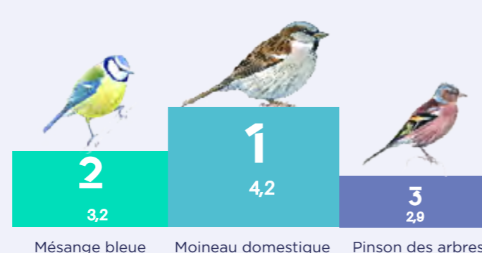
Espèces présentant la plus grande abondance moyenne par jardin en 2020