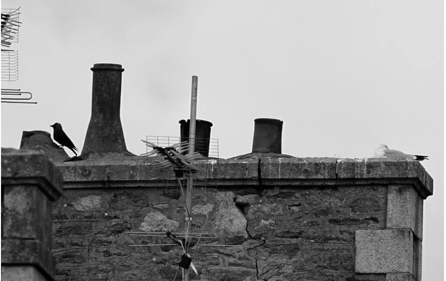
Choucas des tours et Goéland argenté : des nicheurs « gênants » de nos villes ? (Dinan-2015.)