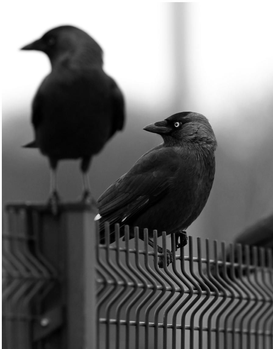
Choucas des tours en milieu anthropisé (E. Chabot)