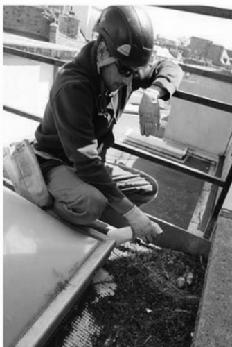
Stérilisation des oeufs de goélands

Les missions de ce service sont triples : mettre en place des mesures prophylactiques contre certains animaux (piégeage de ragondins, stérilisation des oeufs de goélands, effarouchement des étourneaux, déjections canines...); participer à la lutte contre les nuisibles (dératisation, désinfection, désinsectisation...) et veiller au bon entretien des propriétés (friches, déchets divers, pollution...).