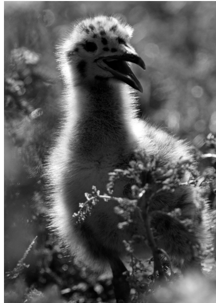
Poussin de Goéland argenté en milieu naturel (Ile-aux-Moines, Perros-Guirec, 2015. Y. Février)

« Il n'y a rien d'inutile en nature ; non pas l'inutilité même. » Montaigne