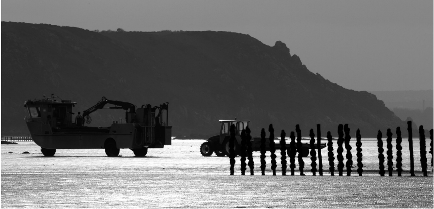
Mytiliculture en baie de Saint-Brieuc (Y. Février)