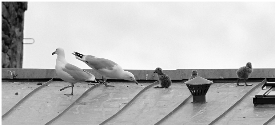
Famille de Goélands argentés « urbains » sur un toit du centre ville de Dinan en 2015

Pour la plupart des gens autour de la table, le simple fait qu'une population augmente indiquerait un déséquilibre anormal