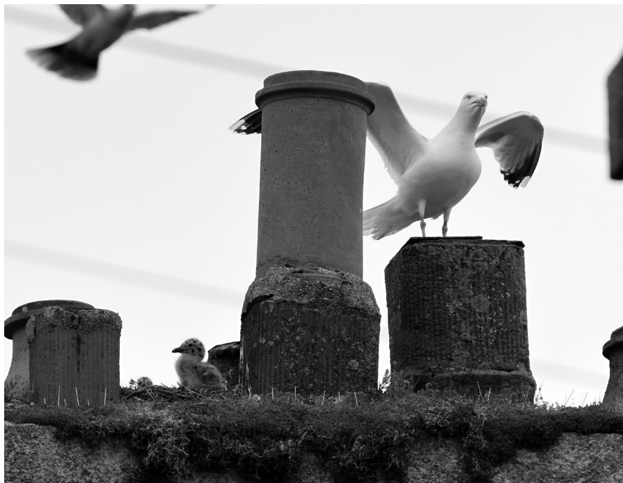
Famille de Goélands argentés « urbains » sur un toit du centre ville de Dinan en 2015

sécurité...). Sur quels points des articles de loi s'appuient donc ces dérogations qui se systématisent en ville pour répondre à quelques plaintes ponctuelles liées le plus souvent au bruit ? A Saint-Brieuc, les bilans annuels font état d'une vingtaine de plaintes annuelles, soit un pourcentage très faible de la population. Mais les stérilisations ne sont pas ciblées aux secteurs de plainte. Elles ciblent surtout les zones de concentration en nids, pas toujours liées aux plaintes comme nous avons pu le constater en 2015 à Dinan. (GEOCA, 2015) Le coût de l'opération ? Supérieur à 10 000 euros annuels au profit d'entreprises spécialisées. Et les causes d'attraction des goélands ? Poubelles, ges-