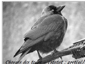
Choucas des tours - (statut : protégé)

Le FECODEC a mis en place une campagne de déclaration des dégâts dus aux corvidés en Côte d'Armor .