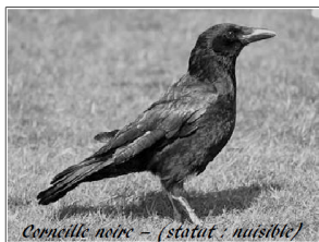
Cormille noire - (statut : nuisible)

La FECODEC et le GDS reçoivent régulièrement des appels les informant de nuisances importantes sur les cultures, liées aux choucas des tours, mais aussi à la corneille noire.